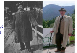
Peter Altenberg 1912 / 2012