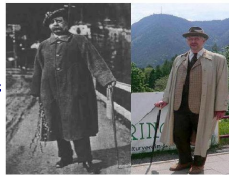
Peter Altenberg 1912 / 2012